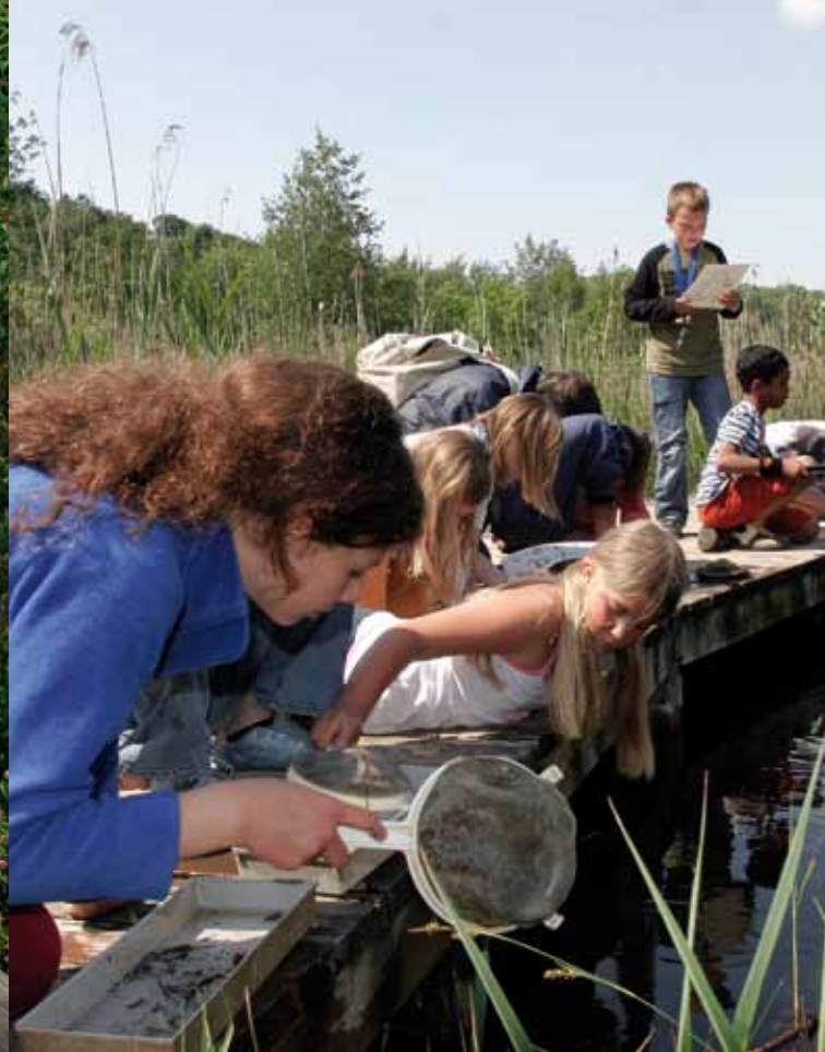
ERKUNDEN, ENTDECKEN, SPÜREN