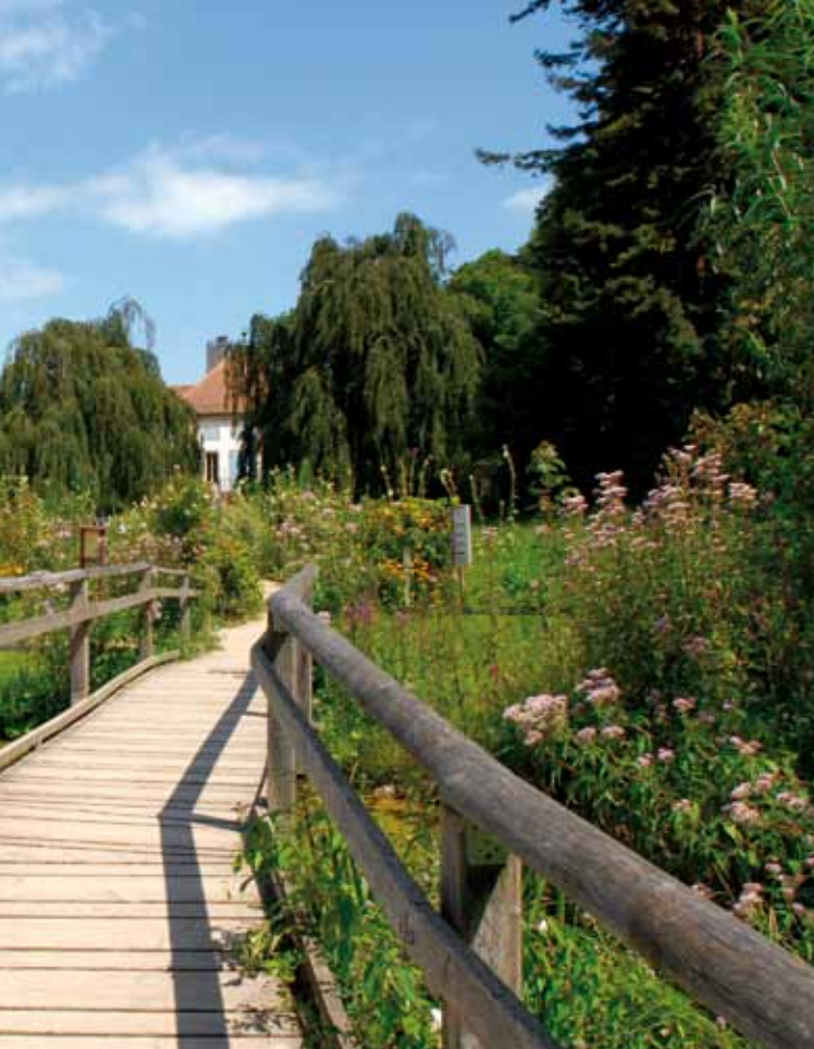
DURCH DIE GÄRTEN FLANIEREN