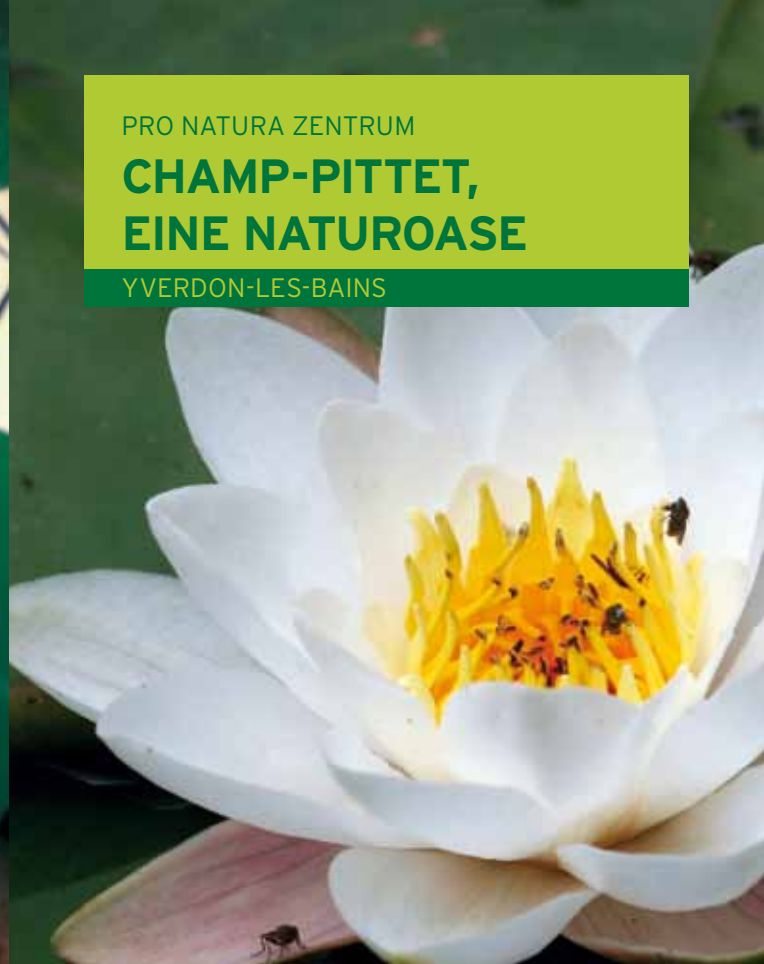
IM RIED BEOBSCHTUNGEN MACHEN

PRO NATURA ZENTRUM CHAMP-PITTET, EINE NATUROASE YVERDON-LES-BAINS