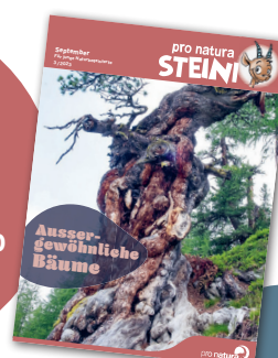
Illustration: L. Fiore

Procure-toi le dossier complet « Les arbres extraordinaires » paru dans le numéro de sept. 2023