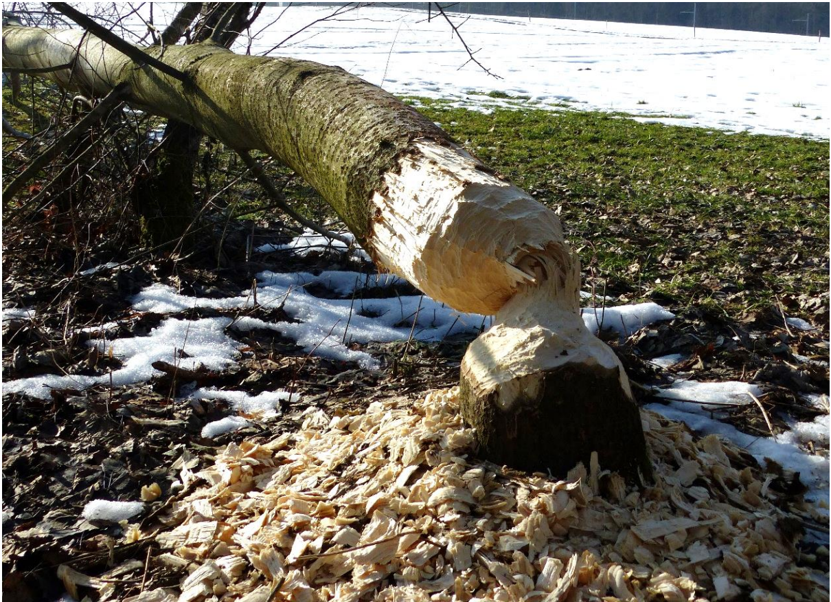
Frassspuren eines Bibers.

Bestand, Verbreitung und Bestandesentwicklung