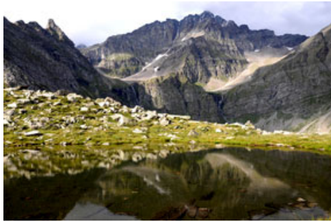
Parc Adula: Laghetto dei Corti in Val Malvaglia con l'Adula sullo sfondo