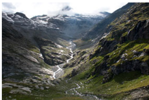
Parc Adula: sorgente del Reno Posteriore ai piedi dell'Adula

Download: www.pronatura.ch/foto-parc-adula