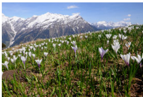
Parc Adula: crochi presso Gorda in Val di Blenio