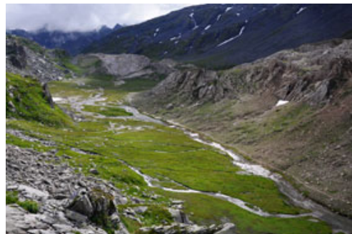
Parc Adula: l'Altopiano della Greina sul versante ticinese