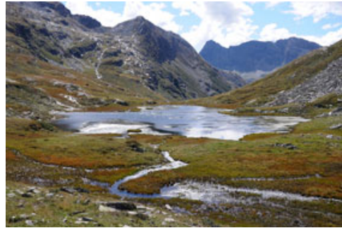
Parc Adula: sul Pass di Passit, tra le valli Mesolcina e Calanca