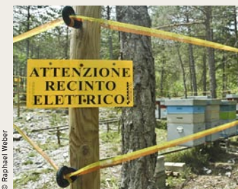
Bienenhäuschen mit Elektrozaun

Bären nehmen sich, was sie zum Leben brauchen. Für Imker und Landwirte kann das zum Problem werden. Doch die Probleme sind lösbar. Bienenhäuschen werden mit einem Elektrozaun vor naschenden Bären sicher. Herdenschutzhunde vertreiben den Bären von Schaf- und Ziegenherden. Fällt dem Bären einmal ein Nutztier zum Opfer, wird es durch Bund und Kanton voll entschädigt. Damit Bären ihr Futter nicht im Siedlungsgebiet suchen, wird der Abfall in bärensicheren Tonnen entsorgt.