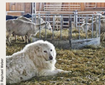
Herdenschutzhunde als Sicherheit