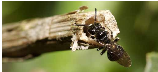
Aus markhaltigen Pflanzenstängeln können im Frühling Wildbienen schlüpfen.

Ab Ende Februar schlüpfen die ersten Wildbienen und suchen sofort nach Nektar und Pollen. Doch dieser ist so früh im Jahr noch knapp. Das können Sie tun: Mit Weide, Krokus, Lerchensporn und Winterling* locken Sie die pelzigen Tierchen im Frühjahr in Ihren Garten. Schneiden Sie ausserdem die Pflanzenstängel aus dem Vorjahr erst im Mai ab. Denn viele sind noch bewohnt von Wildbienenlarven oder -puppen, bis es richtig warm wird.