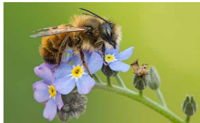
Ein reichhaltiges Blütenangebot im Sommer kommt auch der Roten Mauerbiene zugute.