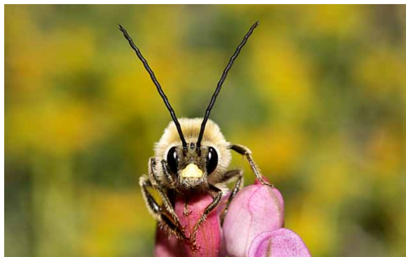
Leicht zu erkennen: das Langhornbienenmännchen mit seinen charakteristischen Fühlern.

Sachte wippt die rosa Blüte, als eine Biene landet und eifrig Nektar zu saugen beginnt. Was hat sie denn da für seltsame Hörner auf ihrem Kopf? Das kann doch keine Honigbiene sein! Und doch sieht sie irgendwie nach Biene aus ... Ja klar, das ist bestimmt die Langhornbiene!